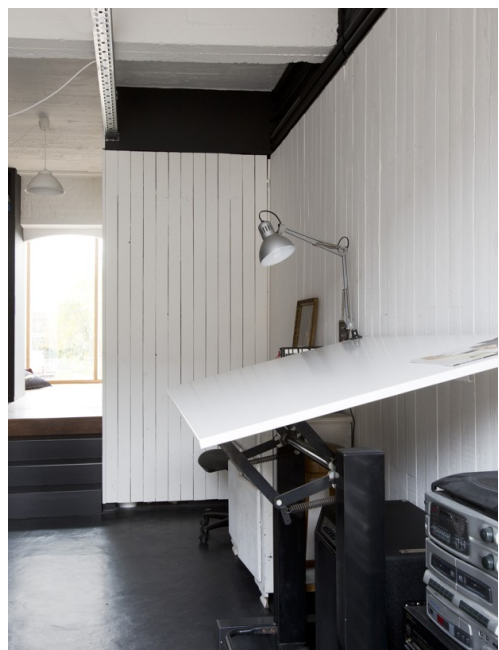
Gerecupereerde vloerlatten doen nu dienst als wandbekleding.

Terreinoppervlakte: 360 m 2 Bewoonbare oppervlakte: 240 m 2 Duur structurele verbouwing: zes maanden Verbouwjaar: 2012 Technisch: centrale verwarming, ventilatiesysteem type C Architect: www.lievendejaeghere.be